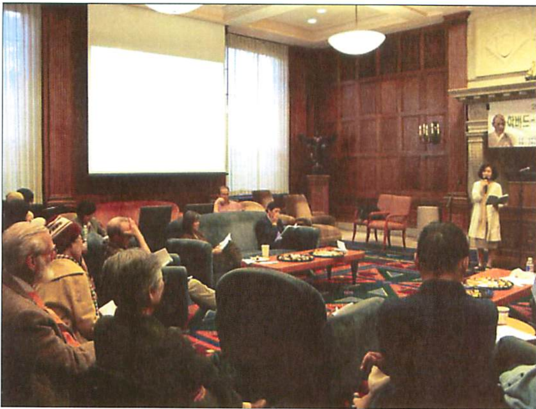
하버드대 베이커센터 톰슨룸에서 열린 시조 낭독회

한국문학의 뿌리에 해당하는 시조가 영어를 통해서 그 문학적 생명력을 새롭게 인정받게 된다면 얼마나 멋진 일인가.