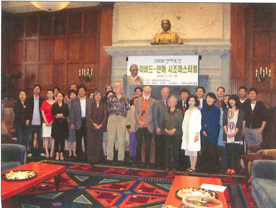
영어시조의 새로운 가능성을 확인한 참석자들.