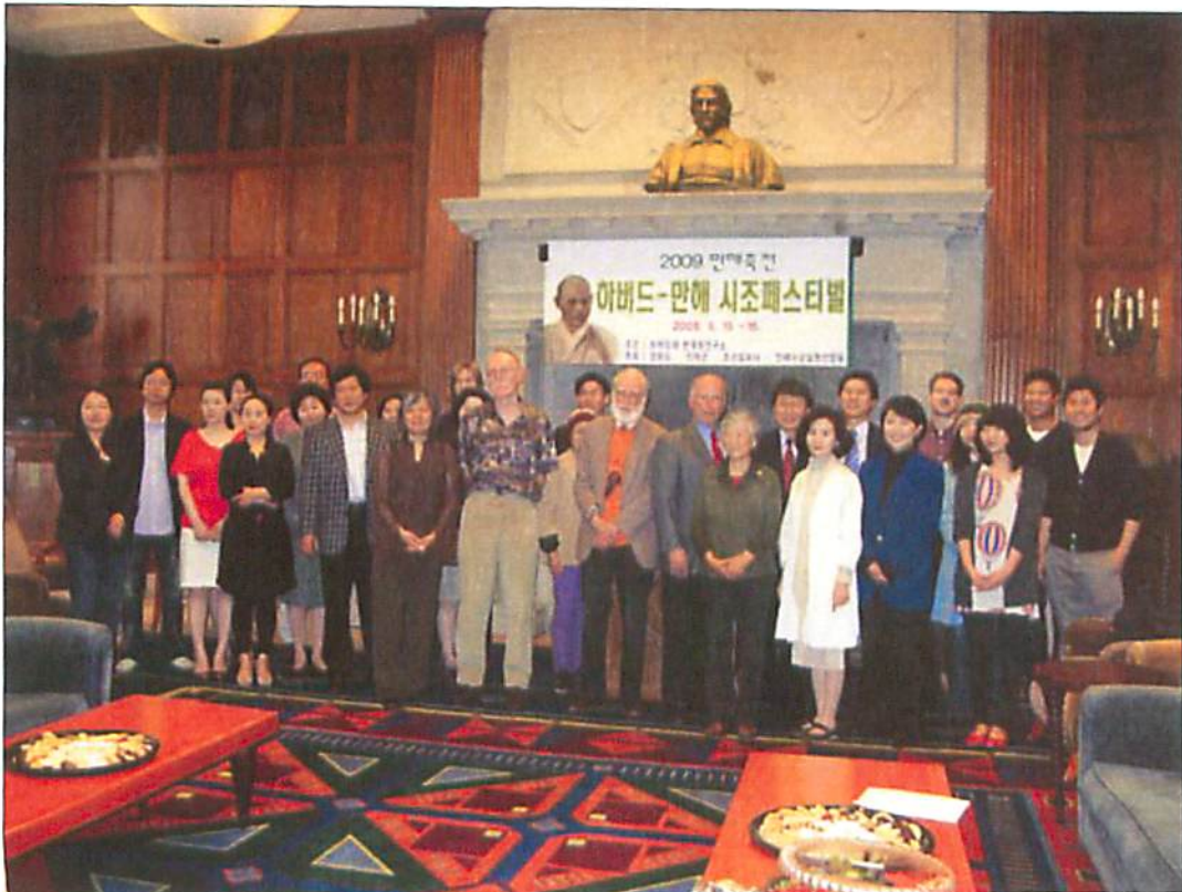
영어시조의 새로운 가능성을 확인한 참석자들.